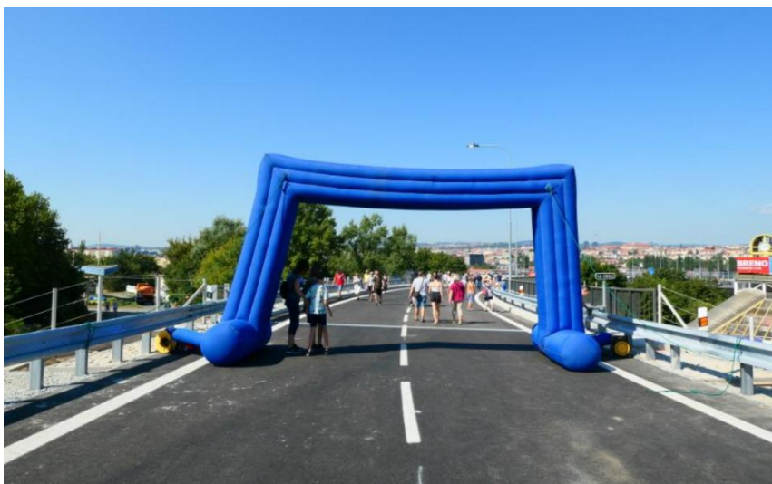
VMO – estakáda Tomkovo náměstí

V září proběhl tiskový brífink k zahájení hloubení průzkumné štolky pro budoucí tunel Vinohrady. Přípravné stavební práce započaly v říjnu poblíž domova pro seniory při ulici Věstonická. Se samotnou ražbou průzkumné štolky se začne v příštím roce. Celková délka tunelu bude 1,5 km a dokončení celé stavby se výhledově plánuje na rok 2030.