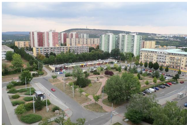
Pálavské náměstí