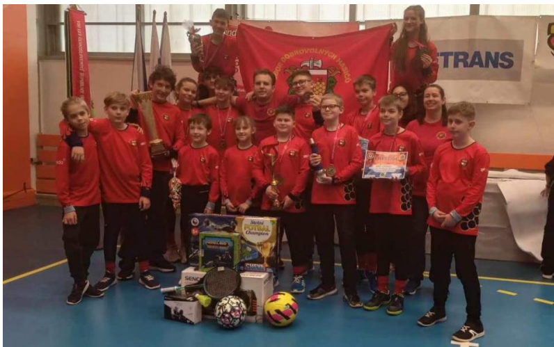
Starší žáci zvítězili na MČR v Havířově; zdroj: facebooková stránka SDH Brno-Vinohrady.

Již druhý ročník Malé Vinohradské olympiády - „Vinohradýady“ se konal 25. května letošního roku. Akce se zúčastnily všechny vinohradské školky a přípravná třída hostující školy. Soutěžilo se v běhu, hodů a skoku do dálky. Putovní pohár si svými výkony nejvíce zasloužily děti z MŠ Bořetická 7. Kromě soutěžení se všichni zúčastnění mohli pobavit při vystoupení mažoretek, vyzkoušet si kouzlo parkouru a obdivovat umění siláků z ragby a florbalu Židenice. Uplatnit svůj talent mohou nejen sportovně zdatné děti, pro všechny zde byla vyhlášena soutěž o výtvarné zpracování návrhu loga a maskota akce.