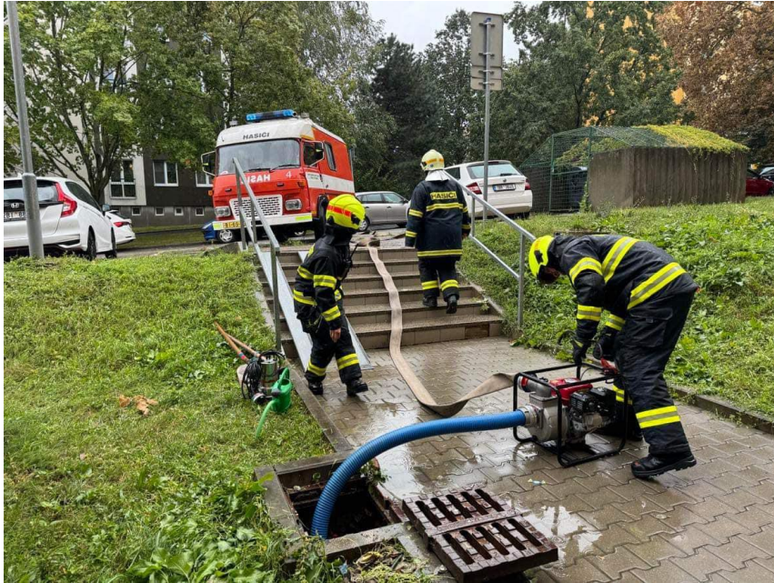
Zásah jednotky na ul. Bzenecká