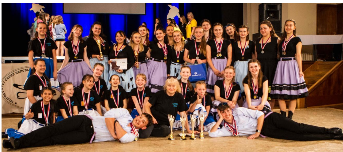
MČR ve Strakonících, zdroj: facebooková stránka Carolka Brno.

Vinohradská taneční skupina Carolka se 10.-12. května zúčastnila 27. Mistrovství ČR v country tancích a cloggingu dětí a mládeže ve Strakonících. Tanečnickům se podařilo získat zlato v moderní country Open, dvakrát titul vicemistr v klasické country a „Show dance“ starší, titul vicemistr v „Show dance“ mladší a v nemistrovských kategoriích získaly děti třikrát stříbro a dvakrát bronz. Poprvé se Mistrovství ČR zúčastnila Carolka před deseti lety v Rakovníku, kde již tenkrát zabodovala a získala bronz, od té doby si z mistrovství přivezla již 36 cenných kovů, z toho 8 těch nejceněnějších.