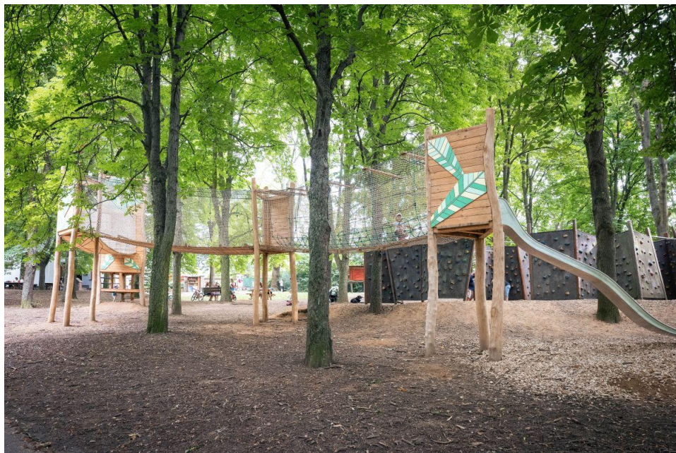
Lesopark Akátky