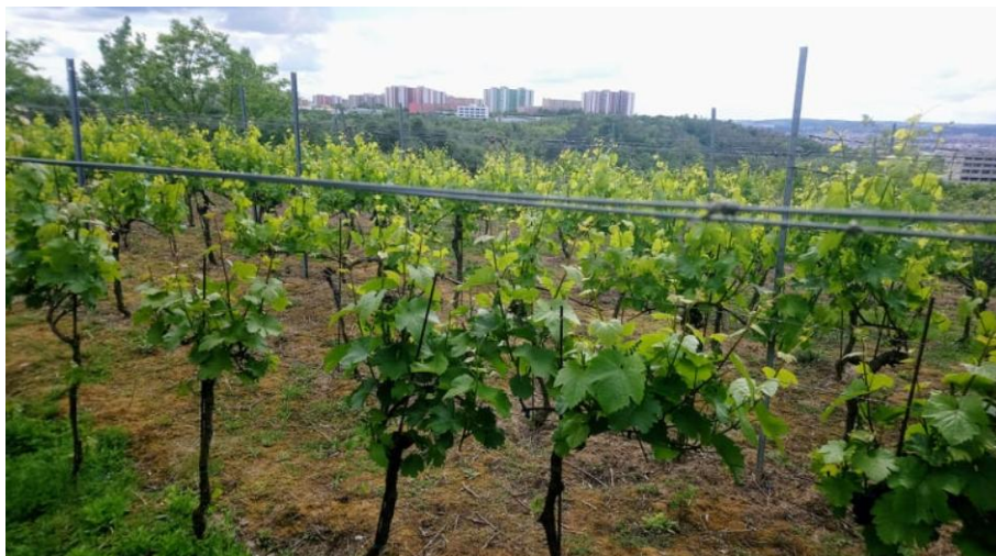
Vinohradská vinice

Dne 16. srpna 2024 došlo v blízkosti Vinohrad k významné dopravní události. Naši obyvatelé měli jedinečnou příležitost se poprvé projít po nově otevřeném úseku velkého městského okruhu – 1249 metrů dlouhé estakádě mezi ulicí Rokytova a Tomkovým náměstím. Pro děti byl připraven doprovodný program a mnoho řidičů tato událost naplnila radostným očekáváním, že se budou moci vyhnout kolonám, které vznikaly na semaforech v židenické ulici Svatoplukova před Tomkovým náměstím, a celkově se spojení Vinohrad s centrem města zrychlí. Na estakádu bude navazovat tunel pod Vinohrady, který pak odvede ruch silniční dopravy mimo sídliště.