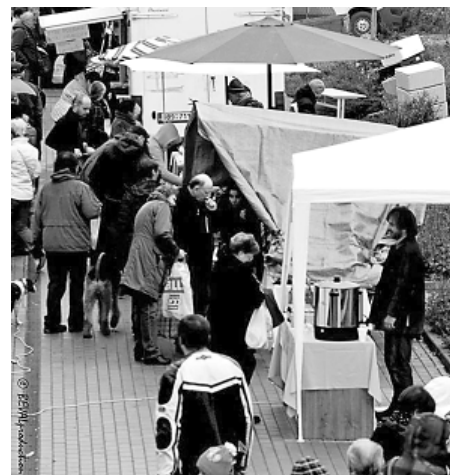
Vinohradské trhy – KVIC