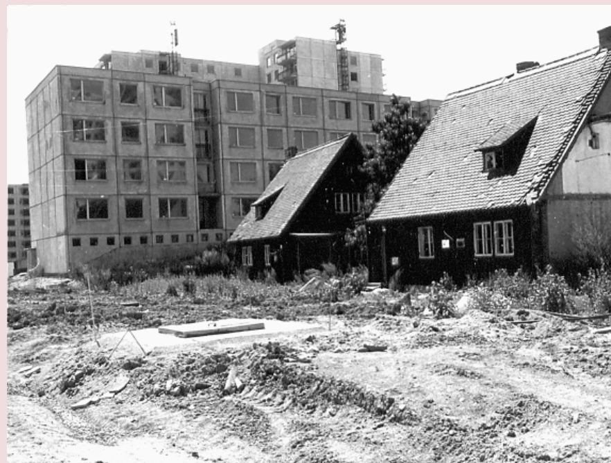
Stopy času (redakce)