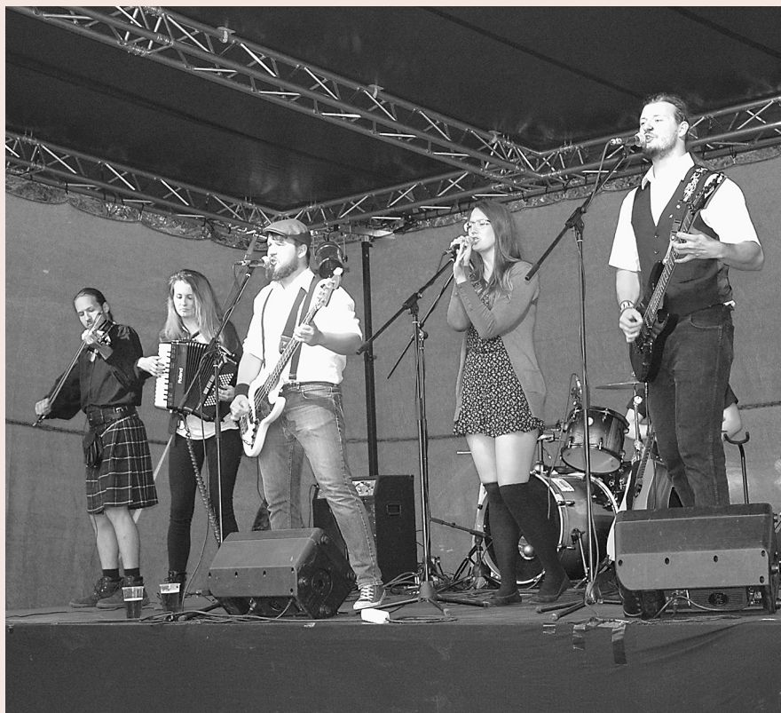
Vinohradský open air festival Mladé kapely 2018 (23. 6.) – skupina Drunken Weasel