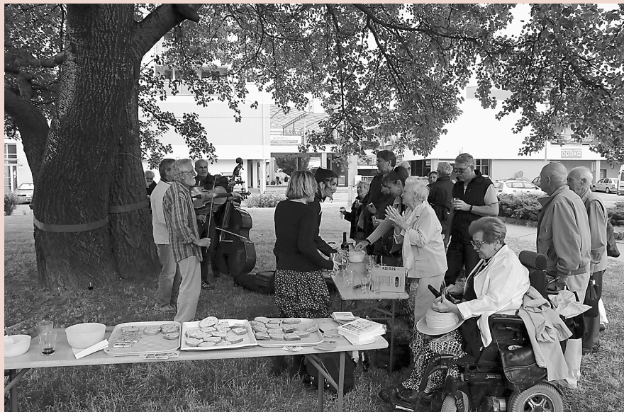
Vinohradský topol šedý se stal vítězem ankety Brněnský strom roku.