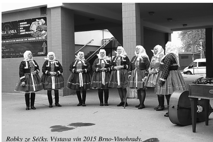
Robky ze Sěčky. Výstava vín 2015 Brno-Vinohrady.