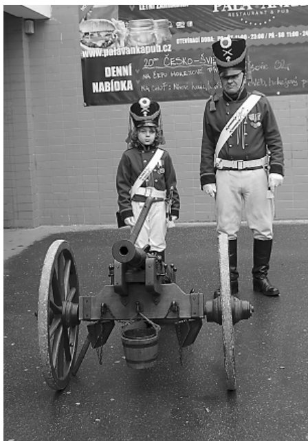
„Dělostřelci“. Výstava vín 2015 Brno-Vinohrady.