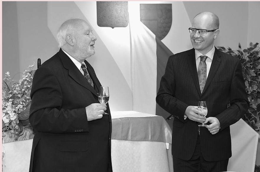
Druhého května navštívil Vinohrady premiér Bohuslav Sobotka. Přijel na tradiční Vinohradskou výstavu vín. V naší obci pobyl věčně zaneprázdněný předseda vlády České republiky přes čtyři hodiny. Víno mu chutnalo, Vinohrady se mu líbily.

Setkání se uskuteční v pondělí 22. 6. v 17 hodin v zasedací místnosti Zastupitelstva městské části Brno-Vinohrady (v přízemí budovy radnice).